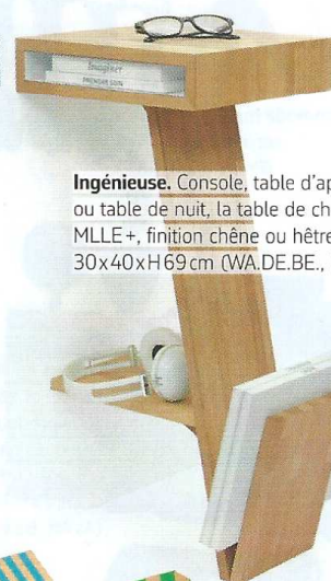
Ingénieuse. Console, table d'appoint ou table de nuit, la table de chevet MLLÉ+, finition chêne ou hêtre, 30x40xH69 cm (WA.DE.BE., 321 €).