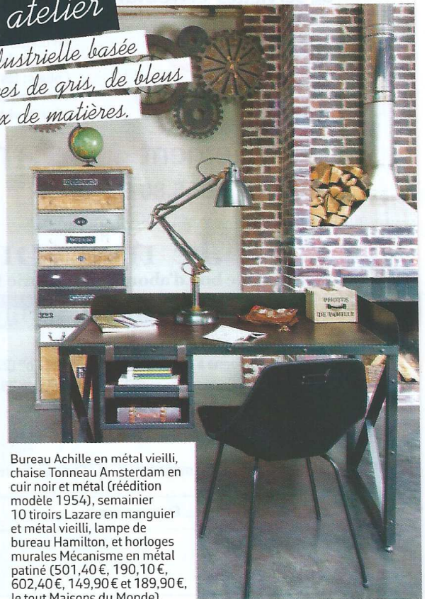
Bureau Achille en métal vieilli, chaise Tonneau Amsterdam en cuir noir et métal (réédition modèle 1954), semainier 10 tiroirs Lazare en manguier et métal vieilli, lampe de bureau Hamilton, et horloges murales Mécanisme en métal patiné (501,40 €, 190,10 €, 602,40 €, 149,90 € et 189,90 €, le tout Maisons du Monde).