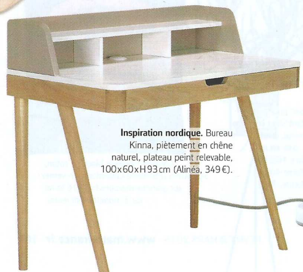
Inspiration nordique. Bureau Kinna, piètement en chêne naturel, plateau peint relevable, 100x60xH93 cm (Alinea, 349 €).