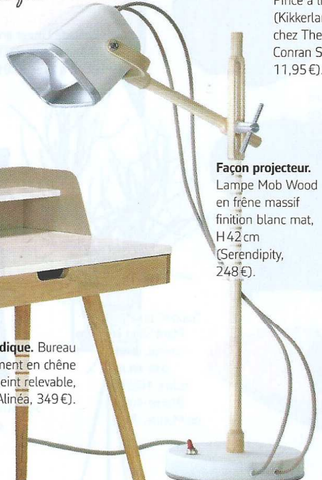
Façon projecteur. Lampe Mob Wood en frêne massif finition blanc mat, H42 cm (Serendipity, 248 €).