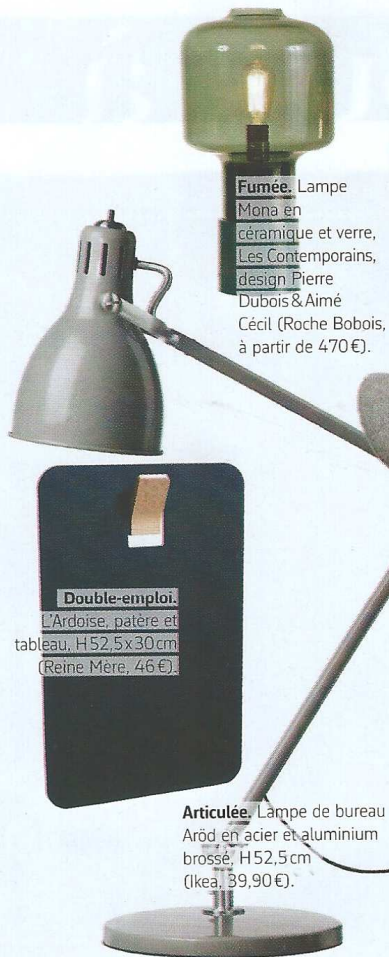
Fumée. Lampe Mona en céramique et verre, Les Contemporains, design Pierre Dubois & Aimé Cécil (Roche Bobois, à partir de 470 €).