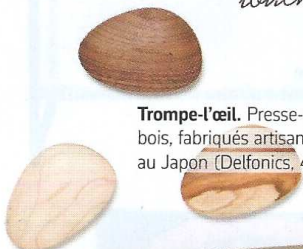
Trompe-l'œil. Presse-papiers en bois, fabriqués artisanalement au Japon (Delfonics, 46 € l'un).

Une atmosphère naturelle et design toute en bois avec des touches de laque blanche.