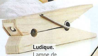
Ludique. Lampe de lecture Pince à linge (Kikkerland chez The Conran Shop, 11,95 €).