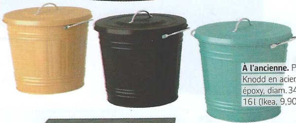
À l'ancienne. Poubelles Knodd en acier, revêtement époxy, diam. 34 x H 32 cm, 16 l (Ikea, 9,90 € l'une).

Ambiance atelier Une déco industrielle basée sur des nuances de gris, de bleus et des jeux de matières.