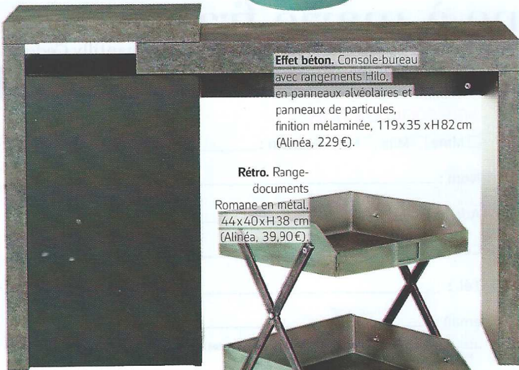
Effet béton. Console-bureau avec rangements Hilo, en panneaux alvéolaires et panneaux de particules, finition mélaminée, 119 x 35 x H 82 cm (Alinéa, 229 €).

Ambiance atelier Une déco industrielle basée sur des nuances de gris, de bleus et des jeux de matières.