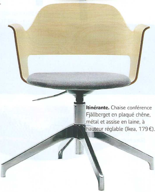
Itinérante. Chaise conférence Fjällberget en plaqué chêne, métal et assise en laine, à hauteur réglable (Ikea, 179 €).