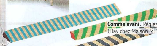
Comme avant. Règles en chêne (Hay chez Maison M Paris, 7€ l'une).