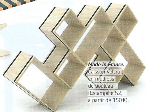
Made in France. Caisson Velcro en multiplis de bouleau (Estampille 52, à partir de 150 €).